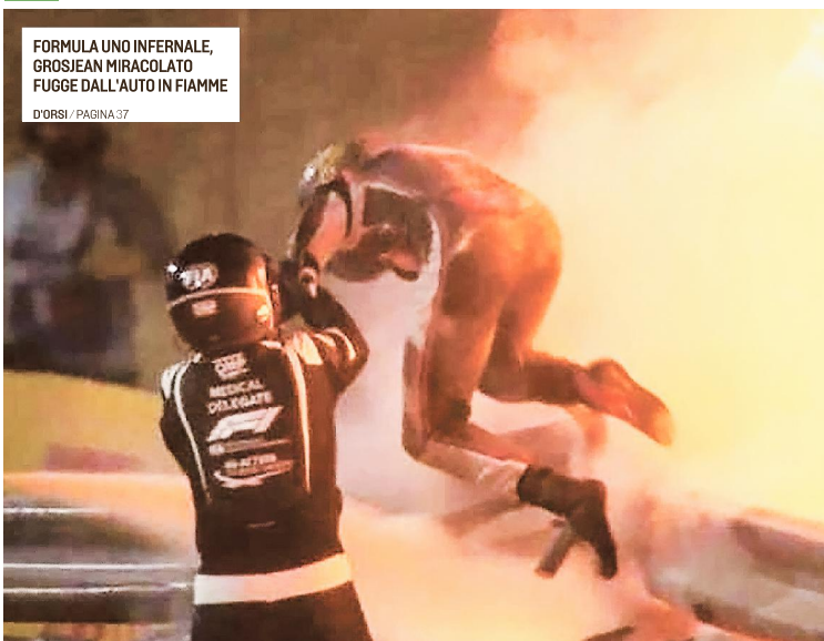
FORMULA UNO INFERNALE, GROSJEAN MIRACOLATO FUGGE DALL'AUTO IN FIAMME