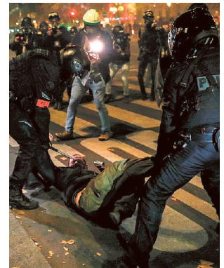
Parigi, un arresto durante le proteste di sabato

La Francia sarebbe malata della sua polizia? In effetti lo si può pensare. A condizione di restare ragionevoli. Da un lato, la popolazione ne diffida sempre più. I giovani, soprattutto nei quartieri più difficili, si sentono discriminati dalle forze dell'ordine e le temono. Il dialogo sul campo fra la polizia e i cittadini si ritrova a un punto morto: ognuno sospetta dell'altro. Attivisti di estrema sinistra come pure numerosi gilet gialli soffiano su questi fuochi e sviluppano un vero odio della polizia, come lo dimostrano lo slogan «tutti detestano la polizia» e l'ingiunzione che rivolgono sistematicamente ai poliziotti («suicidatevi»), sapendo che la polizia nazionale ha registrato 59 suicidi nel 2019 (il 60% in più che nel 2018). Da parte loro, i poliziotti si preoccupano di questo disgusto, dei rifiuti a obbedire sempre più numerosi, del livello crescente di violenza nei loro confronti durante le manifestazioni e in certe zone urbane (in particolare dove c'è il traffico di droga), degli insulti e delle minacce sui social, se non di aggressioni fino nei loro domicili, che